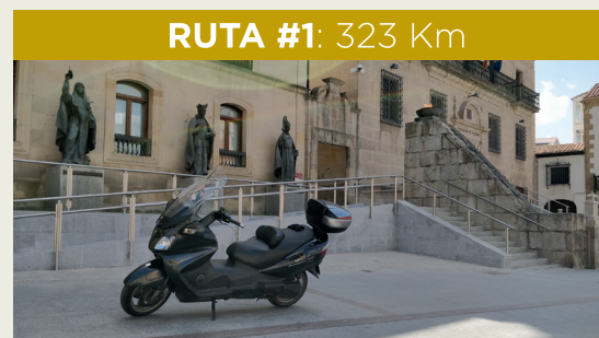
RUTA #1: 323 Km