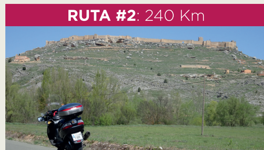
RUTA #2: 240 Km

Oficinas de Turismo: En Garray, y Almazán