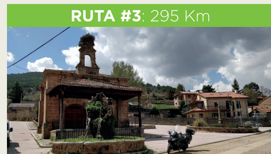
RUTA #3: 295 Km

Oficinas de Turismo: Almazán, Berlanga de Duero, El Burgo de Osma y San Esteban de Gormaz