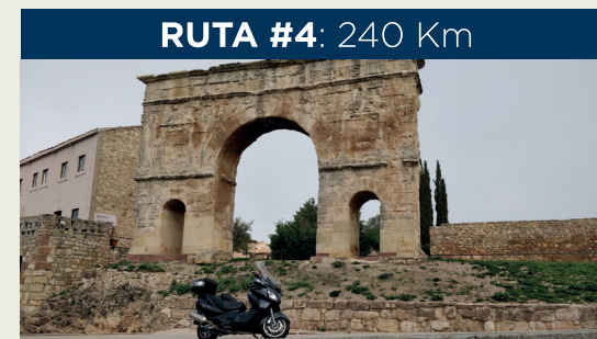
RUTA #4: 240 Km

Of. de Turismo: Vinuesa, San Pedro Manrique y Ágreda